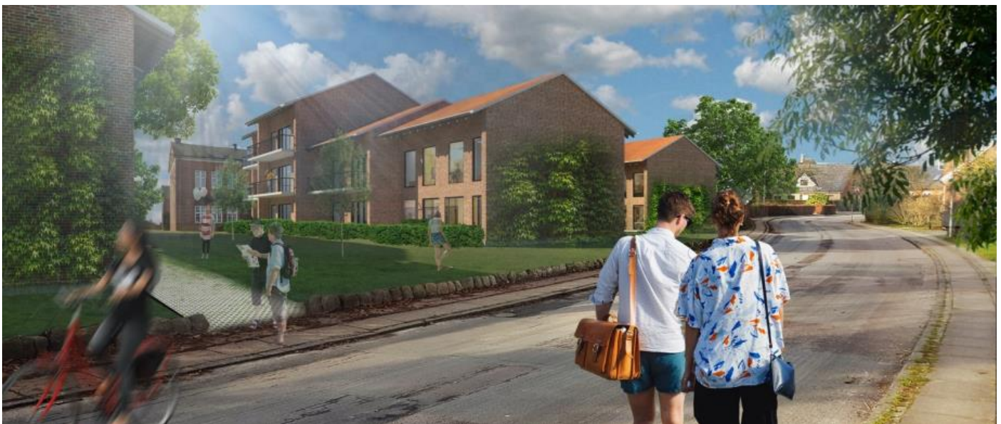
Lokalplansillustration af bygningerne set fra Østergade. På plantegningen er afstanden mellem boligblokkene ca. samme størrelse som bygningernes bredde. Her ser afstanden betydeligt større ud, hvilket giver et meget luftigere indtryk.