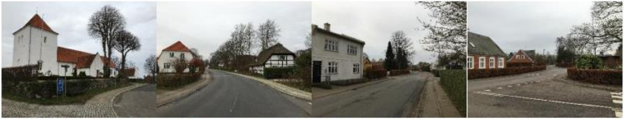
Kirke, Vestergade, Østergade, Stationsbygninger i Østergade.

I forslag til kommuneplanen gennemgik kommunen de omkringliggende gademiljøer, som byggeriet skulle tage hensyn til. Feb 2020