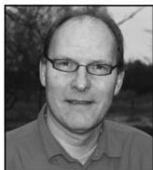
Bo Tune Skovmøllevvej og Tværvej