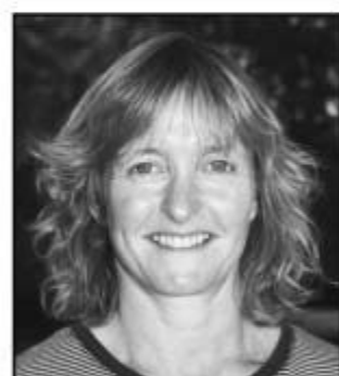
Kisten Refshauge Østre bydel