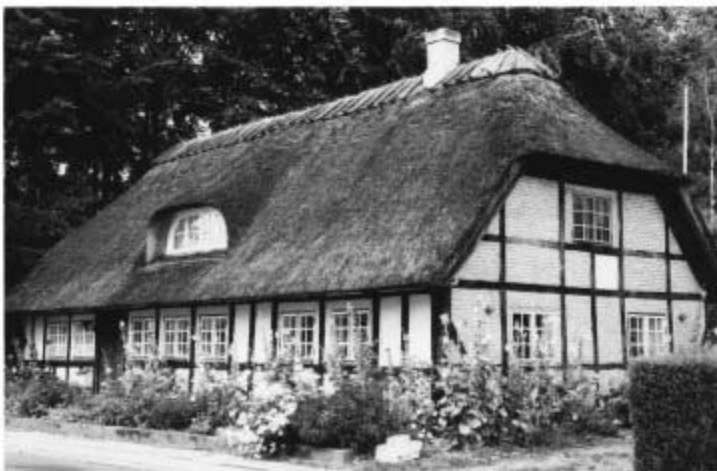
Sk. Vestergade 50