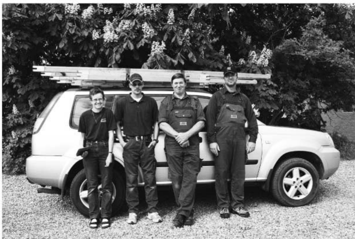
"Skårup Rengøring og Vinduespolering" anno 2010