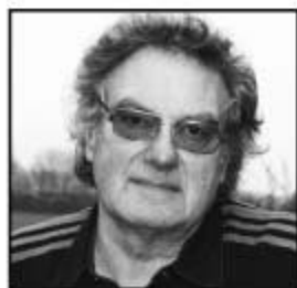
Ansvarshavende Redaktør & Fotograf

Henning Philbert Åbyvejen 8 5881 Skårup Tlf: 62 23 17 88 henningphilbert@mail.dk