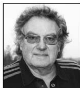
Henning Philbert Åbyskovvej