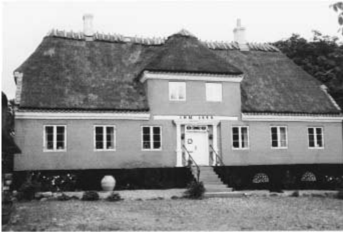
Kirkebakken 3 "Rødegaard"