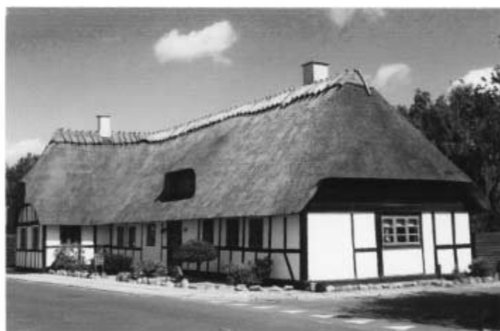
Sk. Vestergade 40