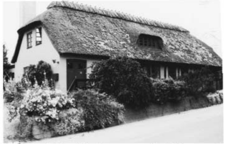
Oluf Ringsvej 24