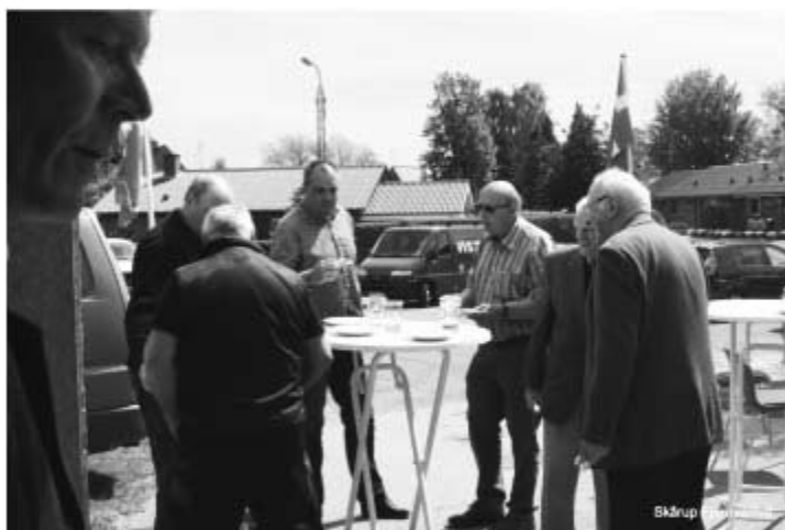
Gæster uden for porten til værkstedet.

Flere billeder fra receptionen kan ses på vores hjemmeside: http://www.skaarup-fjernvarme.dk/ og hvis du vil høre mere om Skårup Fjernvarme er du mere end velkommen til den årlige generalforsamling, som afholdes i slutningen af juni måned. Dette annonceres i bladet Østkysten.