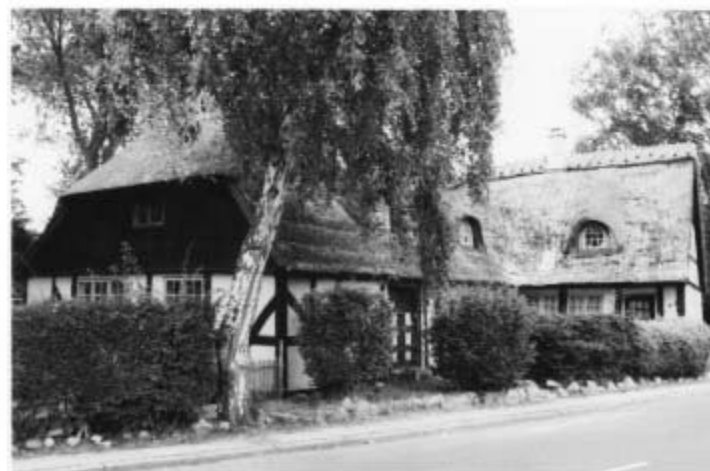
Sk. Vestergade 47