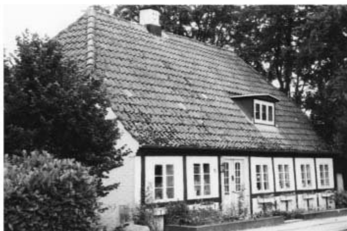
Sk. Vestergade 43