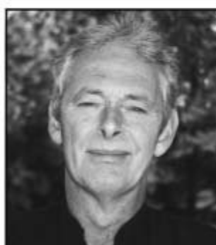
Eiril Frantz Nyborgevej