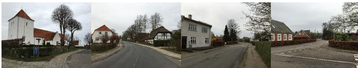
Kirke, Vestergade, Østergade, Stationsbygninger i Østergade.

Nord for hovedbygningen ligger kirken, der understreger seminariets betydning for byens udvikling og de kulturhistoriske bevaringsværdier med udgangspunkt i det præstegårdsseminarie, som det oprindeligt blev opført som. Øst for seminariet ud til Østergade ligger en række stationsbyhuse. Hele seminarieområdet er omkranset af bebyggelse i 1-1½ plan hovedsageligt enfamiliehuse med have omkring.