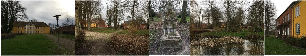
Hovedbygning og tidligere rektorbolig i parken, skulptur, sø i parken, bygningsdetalje.