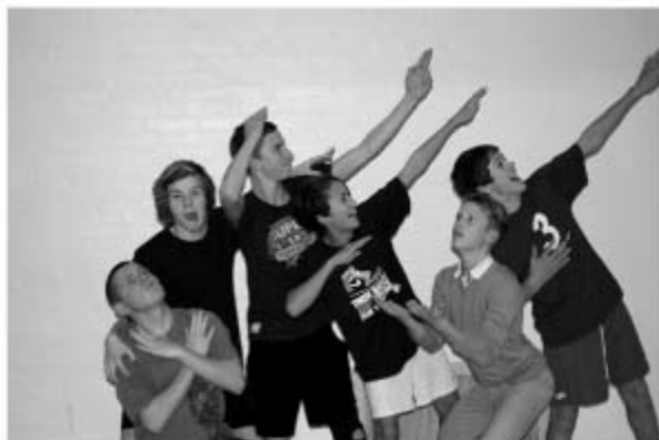
Et af høvdingeboldholdene

Skårup ungdomsklub afholdte i september en høvdingeboldturnering, hvor flere medlemmer fra klubben deltog med egne hold. Det var en stor succes, der tiltrak et bredt og stort publikum. Arrangementet førte til, at der fredag d. 4. februar i idrætshallen var en fælles turnering for alle ungdomsklubberne i Svendborg. Der blev dystet om 1.000 kr., som Skårup Ungdomsklub selvfølgelig vandt.