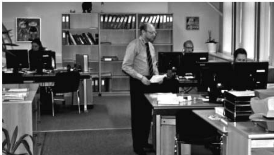
Vue over kontor landskabet.

Ved en pressemeddelelse den 4. februar i år, kunne bestyrelsen udsende et meget positivt regnskabs resultatet for 2010.