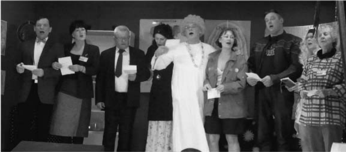
Alle dilettanterne og instruktøren på scenen.