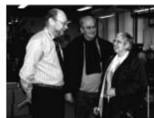
Kunder i butikken