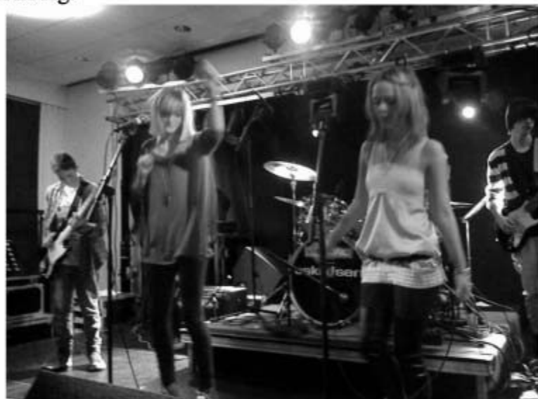
Essay spillede et brag af en koncert, foran et tilfredst publikum.

Udover Essay fra Skårup, deltog flere bands fra Svendborg. Det var ikke første gang Svendborg ungdomsskole har planlagt ture til Ålborg, men til gengæld første gang at et band fra Skårup deltog. De deltagende boede på en skole ikke langt fra Ålborg kongres og kultur center hvor det hele foregik. På skolen var det muligt at købe mad og drikke, og hvile sig lidt. På andendagen fik de deltagende mulighed for at komme en tur til Danmarks største Musikforretning "Eskildsen" i Ålborg.