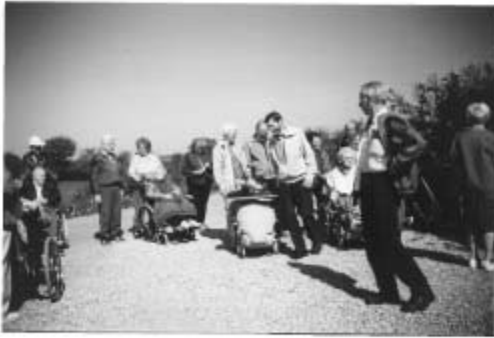
Fra Skårupmarch 1993

undervejs, det første for at få en snaps eller et glas kirsebærvin, og på cirka halvvejen, på Trørvej, eller som engang ved Pæda Lund med, mad og drikkeelse samt kaffe.