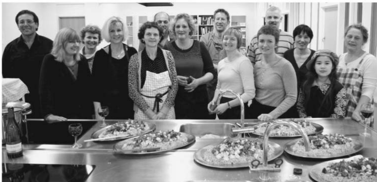
Køkkenholdet der stod for gallamiddagen

Hvordan hænger det sammen med de to tvillingesøstre. Jo! De blev et produkt af de kreative tanker, der blev tænkt. Den ene søster fik navnet "Skårup aften" og den anden "Folk og Fæ". Nogle vil måske undre sig over disse specielle navne, men i dag kan man tydeligt se, at de passer rigtig god til de to 20 årig tøser.