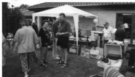
Fotos fra loppemarked på Damgården

Og så blev der rigtigt sat gang i sagerne og spekuleret.