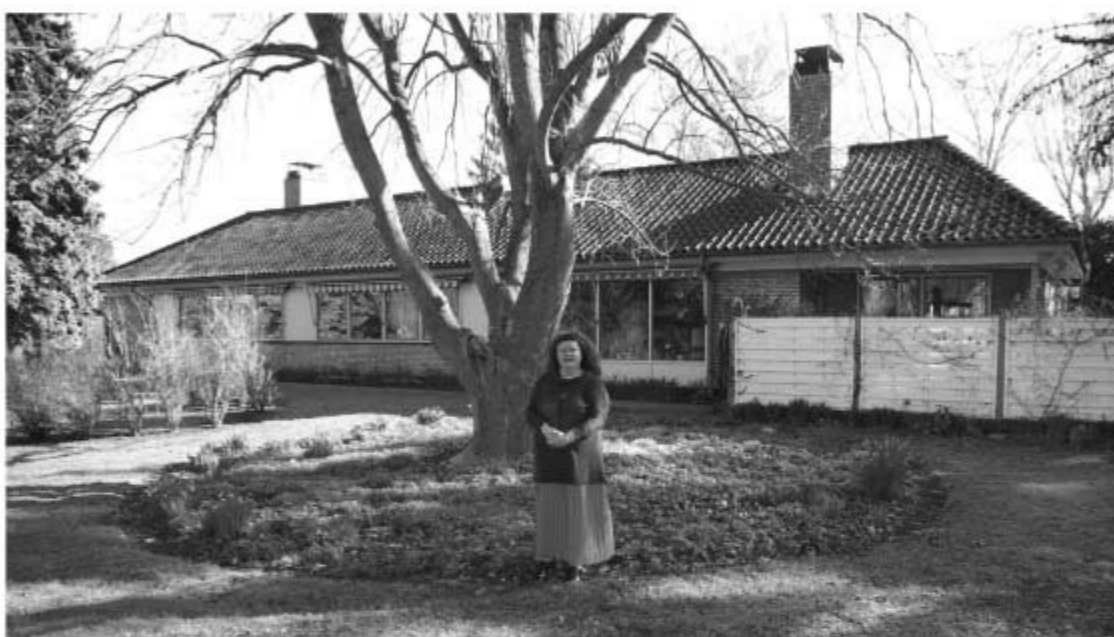
↑ I præstegårdshaven i Skårup

"I Calgary er de næsten færdige med at bygge et helt nyt hus til os. Det er et smalt, men rummeligt træhus inde i byen, og der er ikke nær så stor en have som nu, hvilket jeg har det fint med. Jeg er ikke den store haveentusiast, så det passer mig godt, at jeg ikke skal bruge meget tid med at holde den i orden."