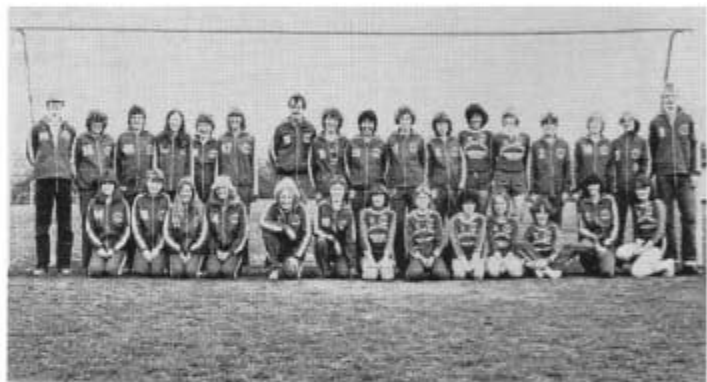
Dame senior i glansperioden 1970 og firserne.