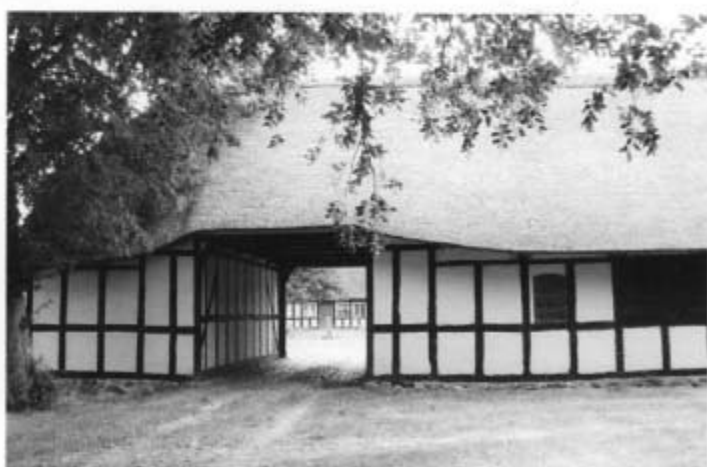
Åbyskovvej 27 "St. Nøjsomhed"