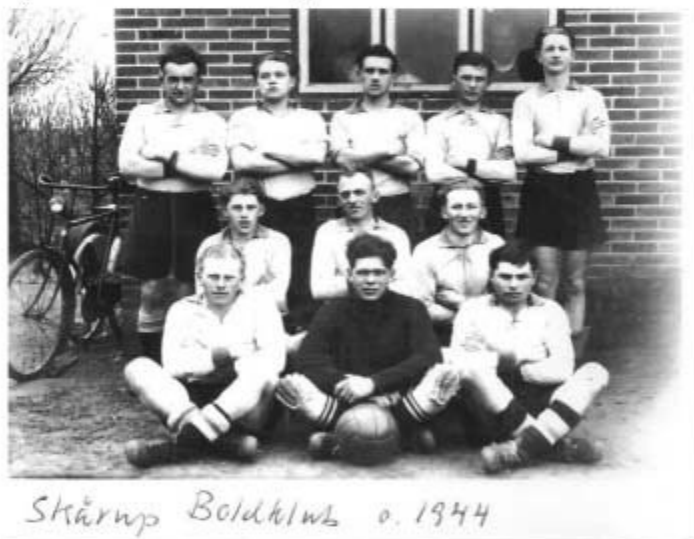
Skårup Boldklub o. 1944

Var der nogen der ville vaskes efter træning og kamp. Var der kun koldt vand under vandposten, som var placeret midt i skolegården.