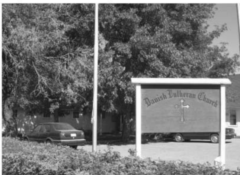
↓ Kirkens indgang udefra

I modsætning til her i Danmark, hvor Folkekirken som nævnt er repræsenteret i enhver mindre by som fx Skårup, er der i Canada kun frimenigheder. Man har altså ikke en 'folkets kirke' ligesom her, hvor vi har både folkeskolen og folkekirken, som økonomisk støttes af staten, om end kirken er selvstyrende. Det betyder, at man i Canada kun har et tilhørsforhold til en kirke, hvis man aktivt har meldt sig ind i en menighed og støtter den både økonomisk og praktisk, altså også arbejder aktivt i og for menigheden.