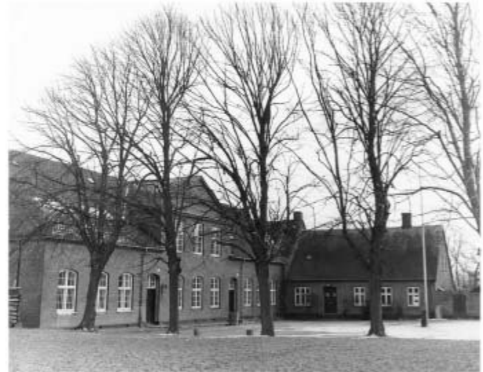
Skolegården i 1933, ingen billeder af vaskeplads og skuret, der i mange år var spillernes omklædningsrum.

Den første fodboldbane ved Gl. Øvelsesskole.