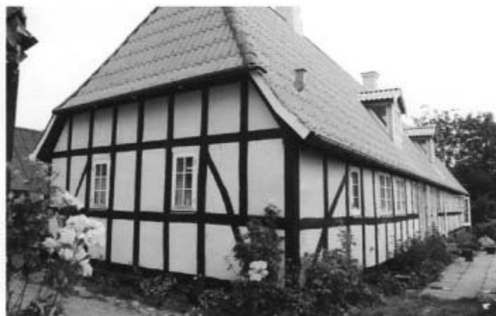
Nyborgvej 500 "Tiljevang"