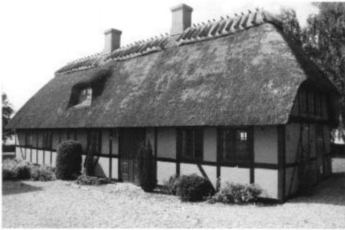
Åbyskovvej 22 "Skyttestedet"