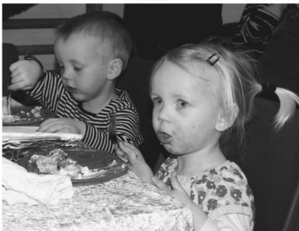
Meget unge med en god appetit på desserter