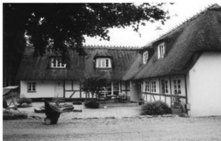
Nyborgvej 494 "Elverhøj"