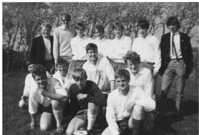
Mikset talenthold med spillere, fra Brændeskov Gudbjerg og Skårup.