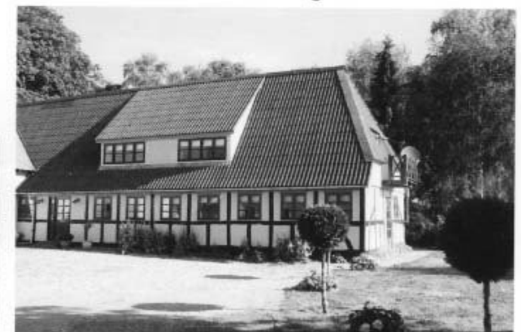
Vængemosevej 3 "Birkelygaard"