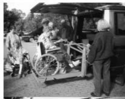
Oscar1 med lift

På Oscar1 var der kun en sliske til kørestole. - Da det var meget besværligt at bruge, skulle der hurtigt spares op til en lift bagpå, og den blev så købt og monteret i 1996.