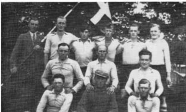
Skårups 1. hold i 1935.

At fodbold gennem årene opnåede så stor en medlemsskare, var der nok ingen, der havde forestillet sig.