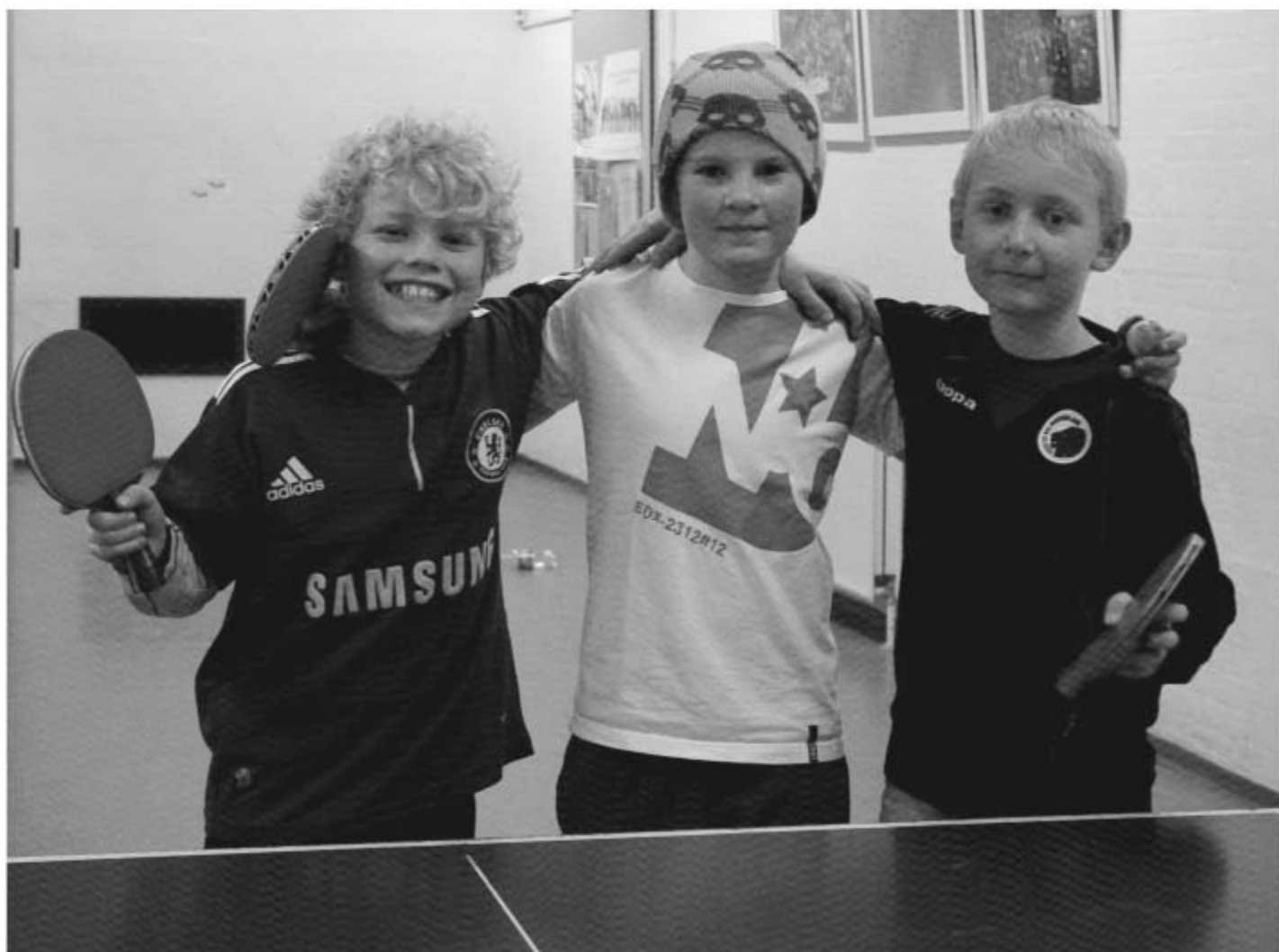
Nogle lidt ældre der havde tid til et slag bordtennis mellem retterne