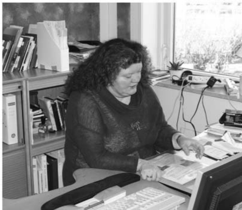
↑ På kontoret i Skårup

"I Skårup har jeg jo også været meget ude på besøg i hjemmene, på sygehus og på plejehjem, hvor der måtte være brug for det. Og det er jo her i landet rimeligt 'nemt', fordi vi bor så tæt og hurtigt kommer fra A til B. I Canada er afstandene enorme og ét besøg kan pga. afstanden tage en hel dag. Det bliver selvfølgelig en hel anden måde at arbejde på. Tilsvarende er der måske ingen konfirmander i Calgary i år. Det, som i Danmark fylder meget i vinterhalvåret, hvor alle konfirmander møder op ugentligt hos præsten, skal jeg i år sikkert slet ikke beskæftige mig med. Er der et år ingen børn, der skal konfirmeres, giver det sig selv."