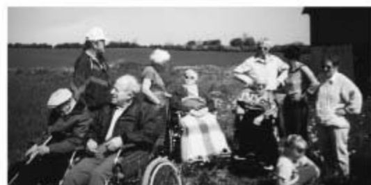
Fra Skårupmarch 1993

Kr. Himmelfartsdag var vi i flere år med i Skårupmarchen med kørestole på 5km. ruten. Med et par ophold