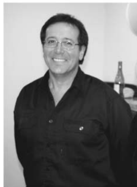
Kok for kulinariske specialiteter fra Sydamerika

Hende der hedder Skårup aften, blev den, der 4 gange i året stod for at arrangere fællesspisning for byens borgere. Med hendes store organisationstalent, fik hun lavet et koncept omkring bespisningen. Borgerne har ud fra dette koncept, på skift lavet mad til hinanden i 20 år, hver 3 fredag i jan., marts, sept. og nov. Med hendes organisationstalent har hun også taget højde for, at alle opgaver uddelegeres. Et styre gruppe er blevet etableret, og den sørger for, at der hele vejen igennem er hånd i hanke, med hvad der skal tages sig af..