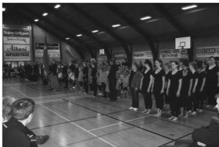
Indmarch og velkomst