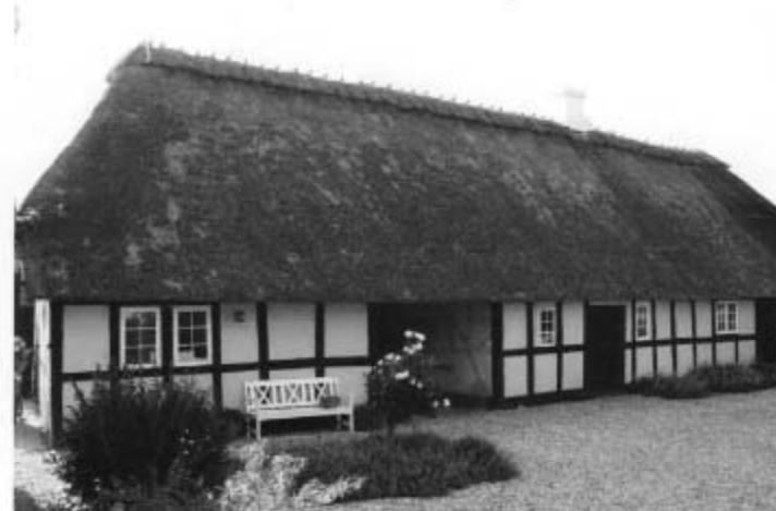
Vængemosevej 7 "Hjelmkilde"