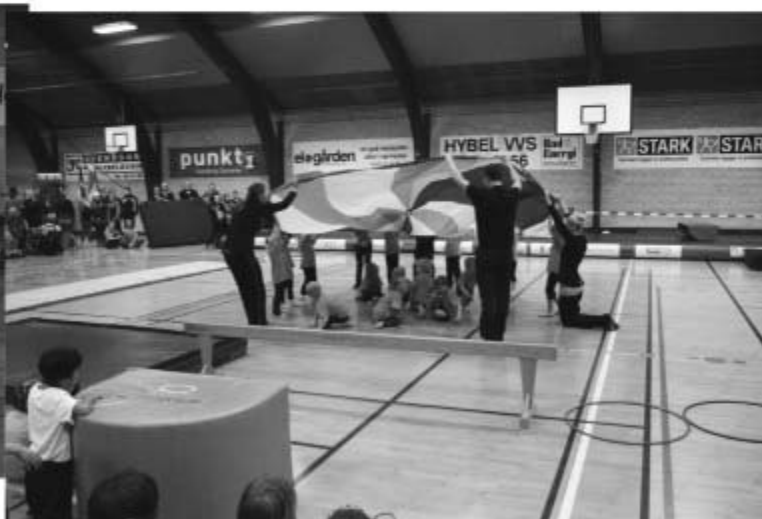
Leg og Bevægelse