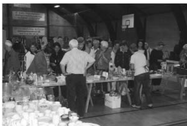
Loppemarked i Skåruphallen

Og nu har vi i flere år afholdt det i Skåruphallen, hvor der er rigtig god plads til at afholde oppemarkedet.