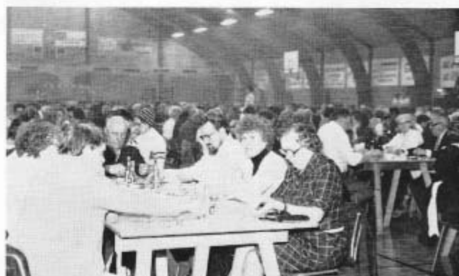
Et kikk ind til »Vennerne« i Skåruphallen, medens der blev spilet på livet løs.

Spillegilderne blev kendt af mange spillelystne, ud over de mange trofaste fra Skårup og omegn, var der i mange år sat busser ind, - 5